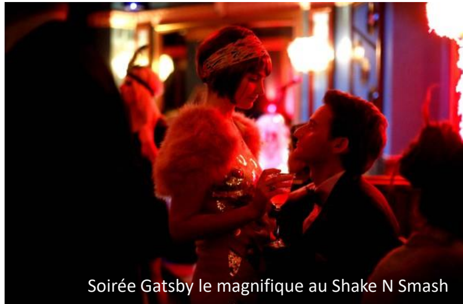
Soirée Gatsby le magnifique au Shake N Smash